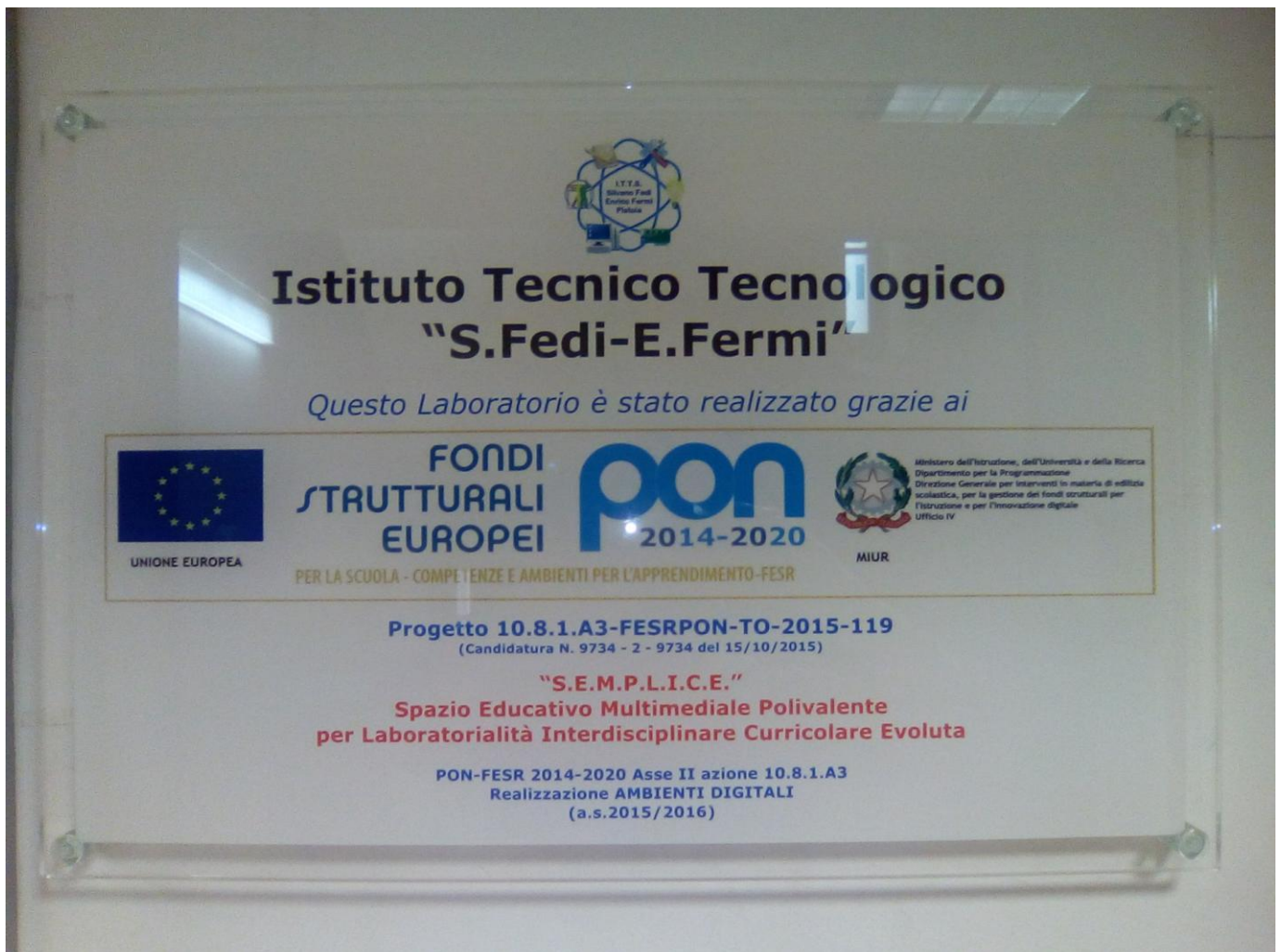
Foto TARGA Progetto e Beni Acquistati con targhetta

Spazio Educativo Multimediale Polivalente Per Laboratorialità Interdisciplinare Curricolare Evoluta"